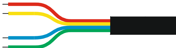
Рис. 5. Назначение проводников кабеля индикатора.

В датчике реализована электрическая защита от «переплюсовки», цепи RS-485 интерфейса защищены от перенапряжения (кратковременно, до 75 Вольт). Тем не менее, во избежание выхода индикатора из строя не допускается неправильное подключение устройства к проводам питания и цифровому интерфейсу: А (RS-485) и В (RS-485).