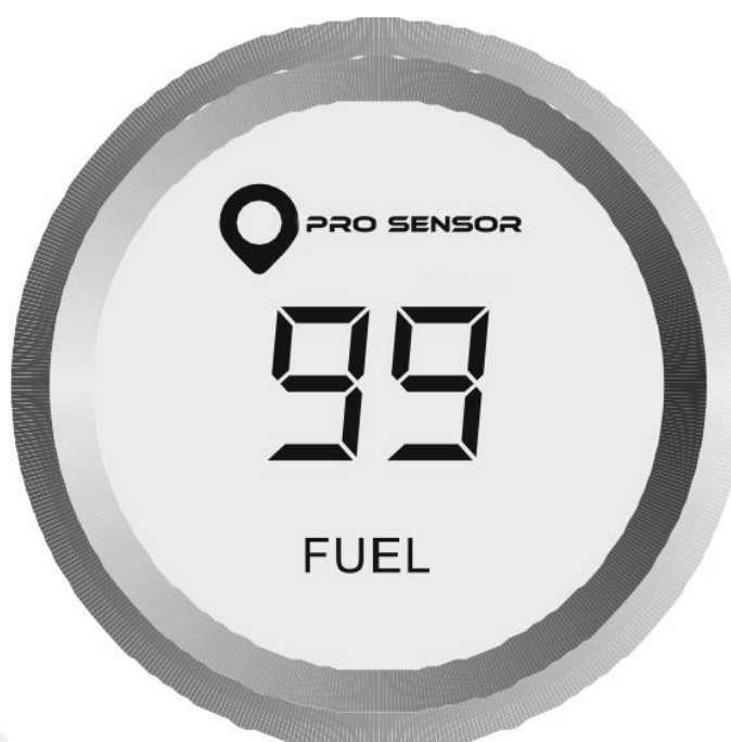
Рис. 5. Общий вид, основные элементы индикатора.